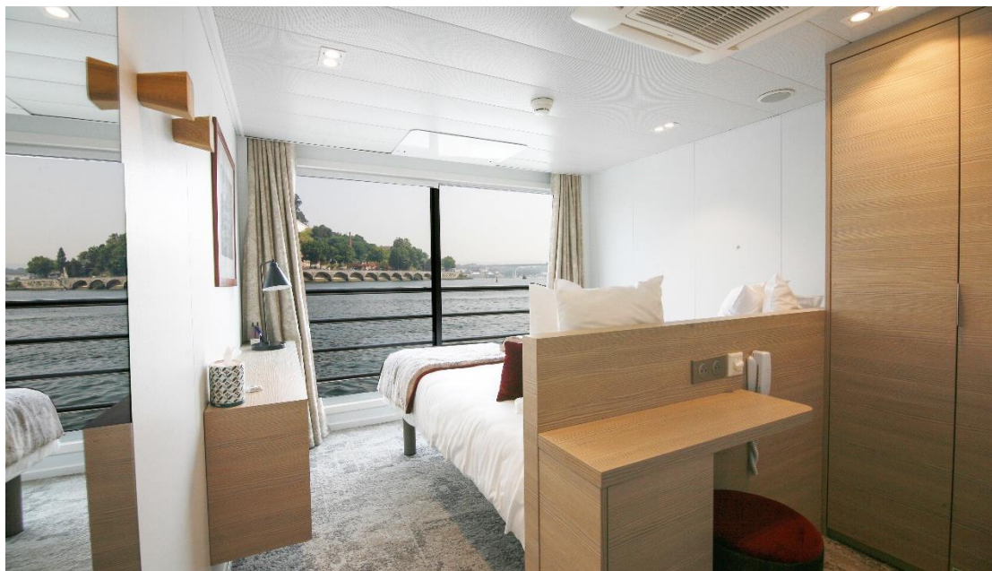
Exempelbild på hur standardhytterna kan se ut på mellan och övre däck

Med reservation för ändringar. Rederiet förbehåller sig rätten att justera programmet och kryssningsrutten till följd av vattenstånd eller andra oförutsedda händelser.